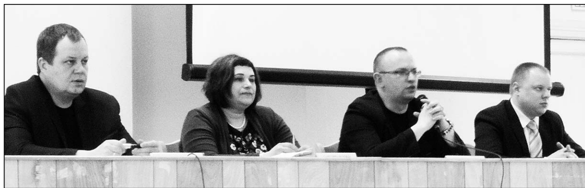
Представители компании ответили на вопросы управляющих организаций

Апатиты. Договоры, контейнеры, крупногабарит – вот далеко не полный перечень тем состоявшегося диалога между представителями управляющих организаций и АО «Управление отходами».